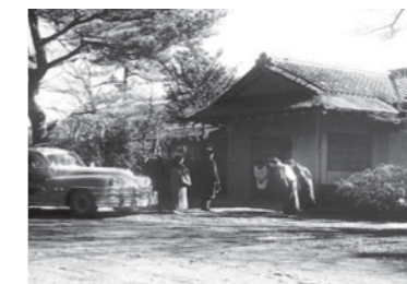
開業当時の箱根小涌園