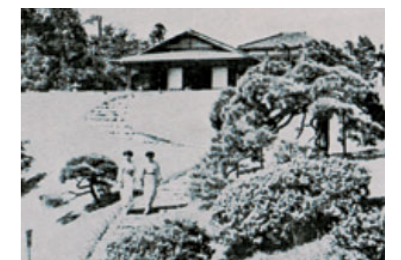
開業当時の「椿山荘」

明治の元勳・山縣有朋の庭園と邸宅を譲り受け、戦後改修し、ガーデンレストランとしてオープン